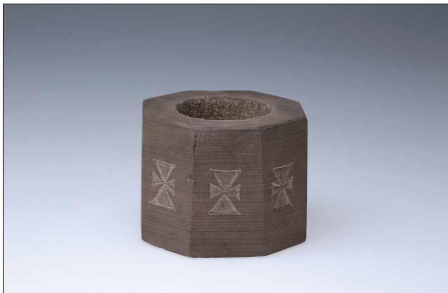
Obr. 7 Schránka na kadidlo z růžového pískovce. Poslední čtvrtina 19. století. Ukrajina, Ternopilský kraj, okres Terebovla (západní Podolí). H4-NS-1235.