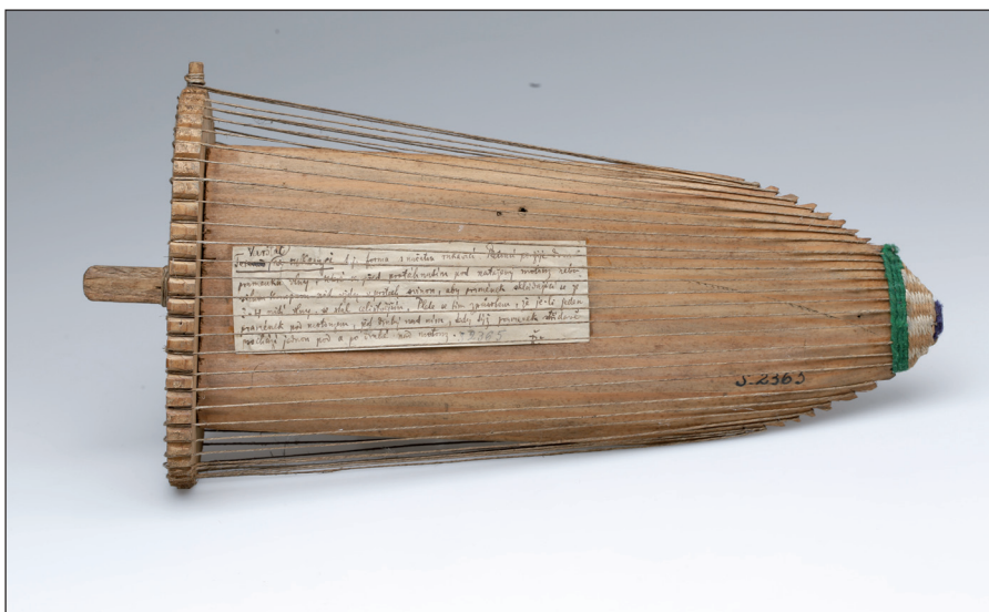
Obr. 2 Dřevěný stávek na pletení rukavic s konopnými nitěmi. Poslední čtvrtina 19. století, Ukrajina, Haličské Huculsko. H4-NS-2365.