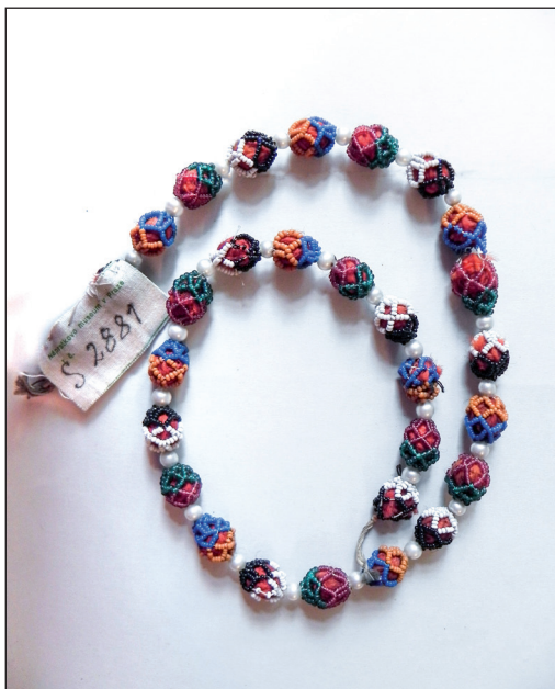
Obr. 1 Náhrdelník – obpletene monysto z drobných korálků – biseru navlékaných na splétaných nitích. 19. století, Ukrajina, Ivano-Frankivský kraj, okres Horodenka (Pokutťa). H4-NS-2881.