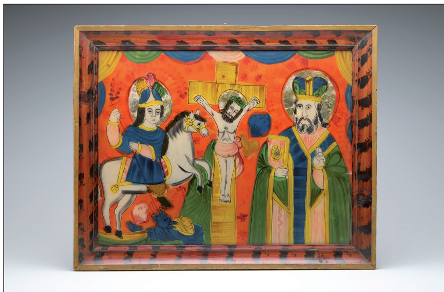
Obr. 4 Obraz malovaný na skle „Sv. Jiří Drakobijec, Ukřižování a Sv. Mikuláš Divotvůrce“ v dřevěném lakovaném rámu. Druhá polovina 19. století, Ukrajina, Haličské Huculsko. H4-NS-1134.