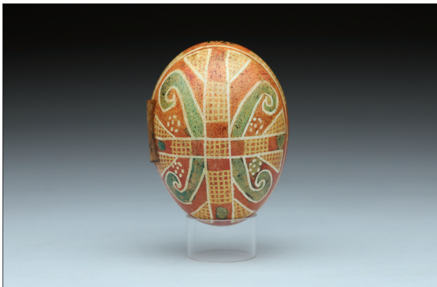
Obr. 3 Velikonoční kraslice – pysanka z roku 1895; kuřecí vejce, přírodní barviva, vosková technika. Ukrajina, Ivano-Frankivský kraj, okres Kolomyja, obec Zaluččja nad Prutom (Pokutťa). H4-NS-3761.