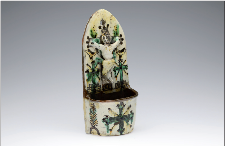
Obr. 6 Keramická glazovaná kropenka kropylnycja s rytím a malbou. Poslední čtvrtina 19. století, Ukrajina, Ivano-Frankivský kraj, okres Kosiv (Haličské Huculsko). H4-NS-1786.