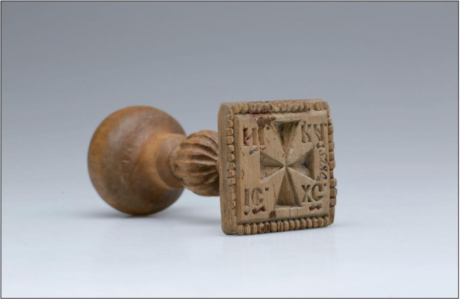
Obr. 5 Dřevěné vyřezávané pečetidlo – znamenyk na liturgické chleby – proskury . Poslední čtvrtina 19. století, Ukrajina, Ternopilský kraj, okres Terebovla, obec Strusiv (západní Podolí). H4-NS-1191.